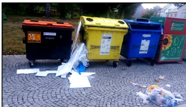
JINDŘICHOVICE - pohled na nádoby dne 11. srpna 2018 v 7:30 hodin, kdy okolní stanoviště v obci byla poloprázdná.

Věřím, že příště u původce odpadu zvítězí „zdravý selský rozum“ a odpad odloží do jedné z poloprázdných nádob. Myslím si, že si naše vesnička zaslouží, aby byla čistá.