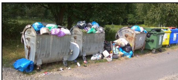
MEZIHORSKÁ - stav kontejnerů zdokumentovaný dne 23. července 2018 po běžném víkendovém nájезdu chalupářů.