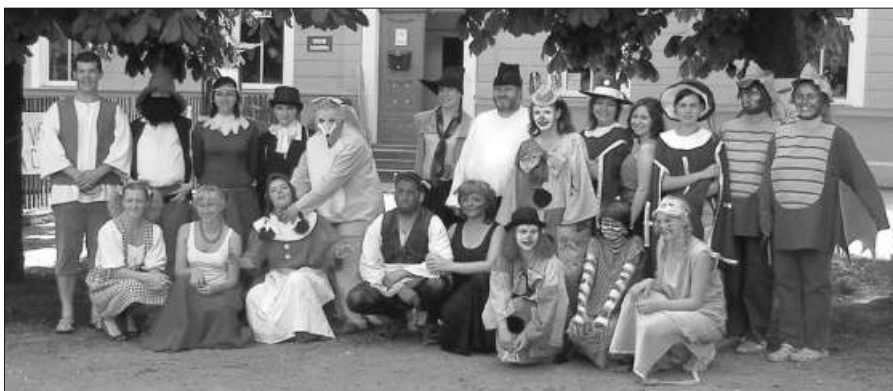
Poslední květnovou sobotu se opět slavil Den dětí. Více na str. 4 a 5