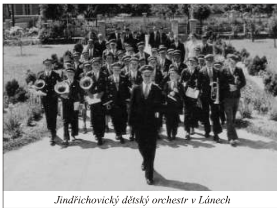
Jindřichovický dětský orchestr v Lánech

Ve dvě hodiny odpoledne pak čtyřicet dětí v modrých kazajkách a čepicích nastoupilo v parku s hudebními nástroji a začalo hrát. U oken zámku je ve stoje poslouchali T. G. Masaryk, jeho syn Jan, paní Alice a prezident Beneš s chotí. Nejprve zazněl Prezidentský pochod, následovaly fanfáry z Libuše a