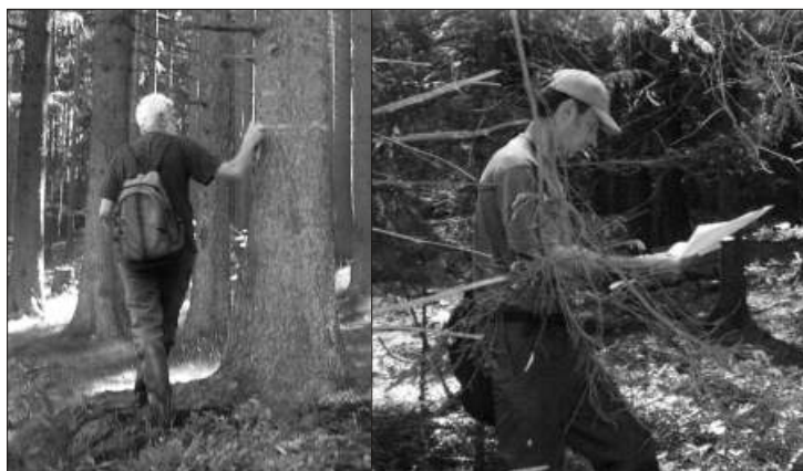
Zeměměřičské práce při přebírání lesního majetku