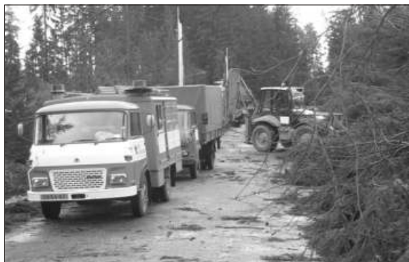
Cesta mezi Jindřichovicemi a Šindelovou