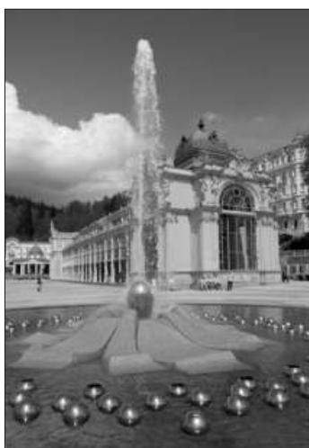
Mariánské Lázně - zpívající fontána