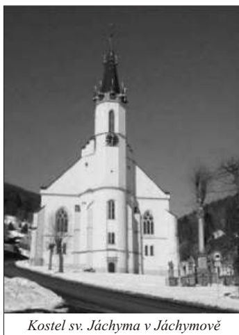
Kostel sv. Jáchyma v Jáchymově