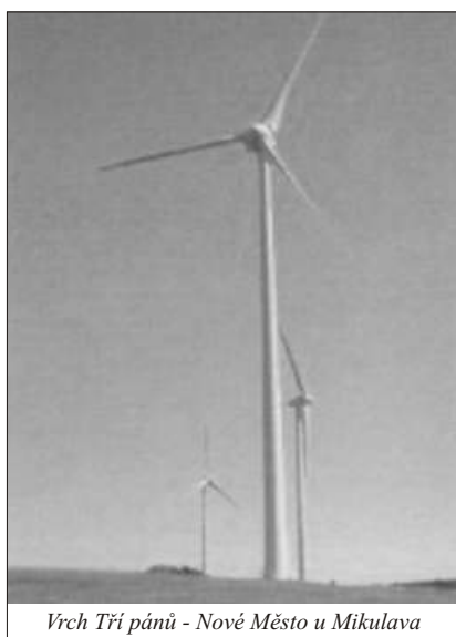
Vrch Tři pánů - Nové Město u Mikulova