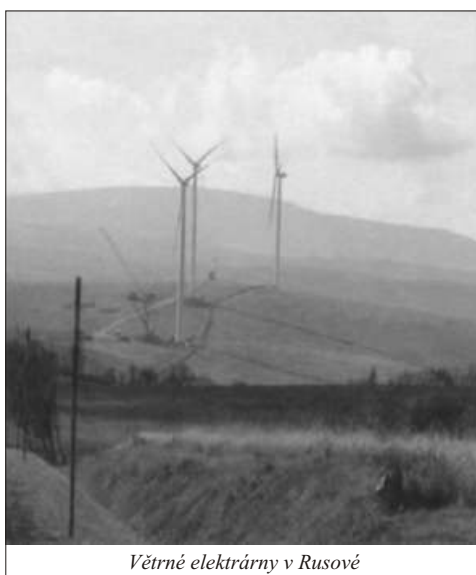
Větrné elektrárny v Rusové