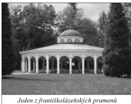
Jeden z františkolázeňských pramenů