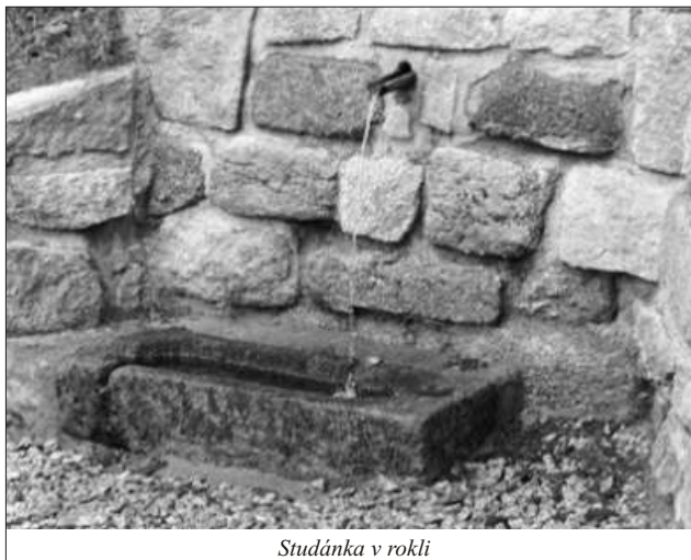
Studánka v rokli

Není to tak dlouho, co jsme se radovali z nově vybudované Žebrácké studánky v rokli v Jindřichovicích. Vybudovali ji ve svém volném čase členové Okrašlovacího spolku spolu s dobrovolnými hasiči a některými dalšími občany, a to bez nároku na odměnu. Bylo to zrovna v době, kdy obec trpěla nedostatkem vody. Když je sucho, chodí sem spousta našich občanů pro vodu. Bohužel vandalové urazili dřevěný žlábek pro proudící vodu, rozlomili kamenný křížek, rozbili hrníčky, prolomili poklop horní nádrže a vhodili jej dovnitř. Víím, že děti občas nějakou tu lumpárnu provedou. Byli bychom však rádi, kdyby rodiče dětí,