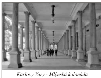
Karlovy Vary - Mlýnská kolonáda