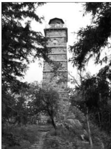
Rozhledna na Tisovském vrchu

Začátek cesty bude na nádraží v Nejdku. Odtud vystoupáme motoráčkem až do zastávky Tisová. Cestou projedeme třemi tunely, zdoláme velké převýšení a pokocháme se krásnými výhledy do kraje. Z Tisové se vydáme už pěšky po modré a později po žluté turistické značce na vrchol Pajndlu (též Peindl, Peindlberg, Tisovský vrch). Po příkrém stoupání po kamenité cestě budeme odměněni jedním z nejlepších krušnohorských výhledů z