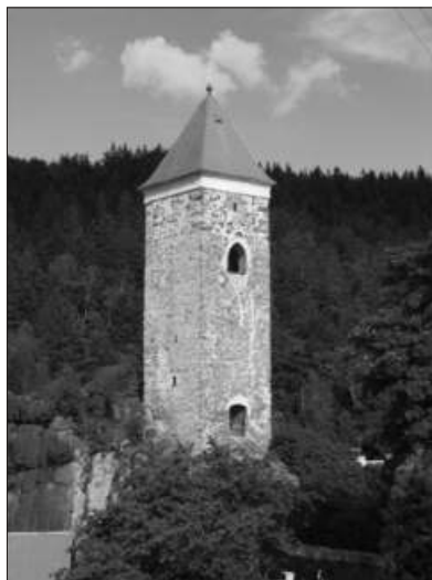
Nejdecká Černá věž

Pokud nám zbyde čas, můžeme navštívit městské muzeum s národopisnými sbírkami z Nejdecka. Nyní je navíc v prostorách muzea umístěna výstava zaniklých železničních tratí, do konce roku budou