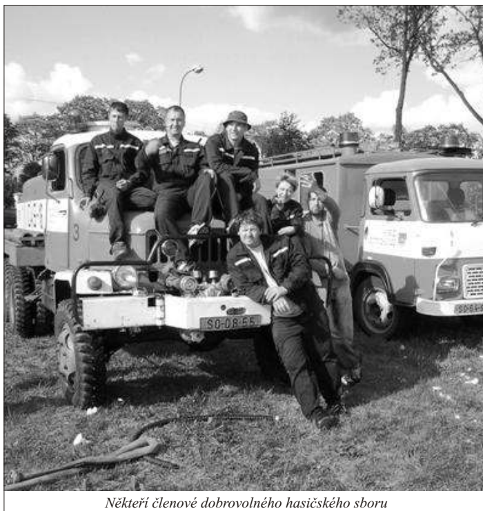
Někteří členové dobrovolného hasičského sboru