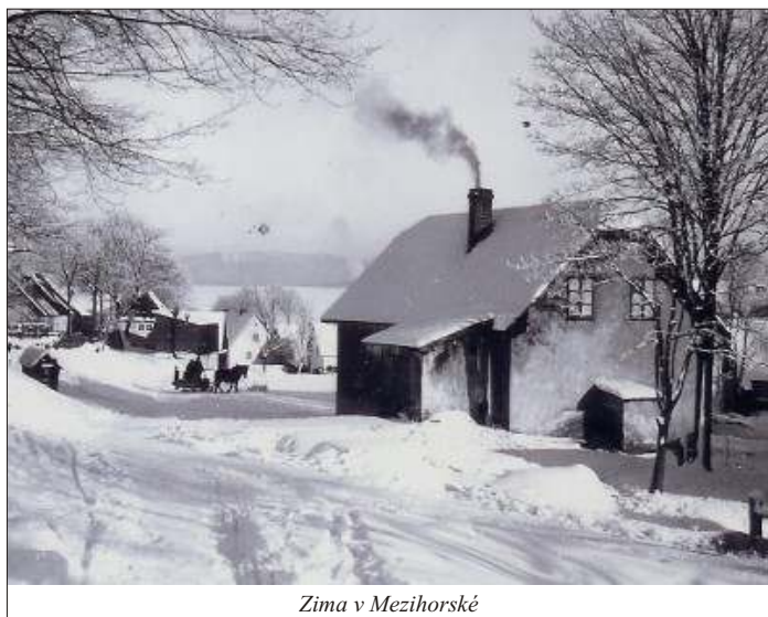
Zima v Mezihorské

...19. června 1927 se v Mezihorské konal okrskový den hasičů okrsku č. 85. Zúčastnilo se ho 24 spolků a přibližně 450 hasičů. Všichni