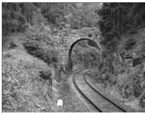
Kamenný most nad tratí Karlovy Vary - Potůčky

Od této chvíle půjdeme už jen z kopce. Kousek ještě po žluté, pak už stále po zelené. Ta nás po 0,5 km vyvede z lesa na horské louky s několika chalupami, které tvoří okraj vsi Tisová. Dále se dostaneme na kamenný most, pod nímž v hlubokém zářezu prochází železniční trať. Ještě jednou se dotkneme Tisové a po asfaltové silnici dorazíme k místu zvanému Krásná vyhlídka. Zde se můžeme občerstvit ve stejnojmenném hotelu s příjemnou restaurací a vyhlídkovou terasou. Pod sebou máme Nejdeck jako na dlani.