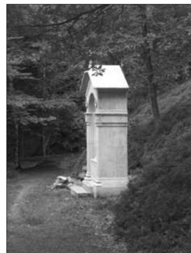
Jedna z kapliček na Křížovém vrchu

Kdo bude unavený, může do města sejít po značené cestě, ovšem přijde o nevšední zážitek. My se raději vydáme na nejvyšší místo Křížového vrchu (chce to trochu trpělivosti, snažíme se jít stále po hřebeni). Tam je na upravené skále s vytesanými schody vztyčen kříž s Ježíšem. O něco níže mineme ruiny barokní kaple a sestoupíme do Nejdku po 1600 m dlouhé křížové cestě se 14 kapličkami. Cestou si nenecháme ujít Rajmanovu vyhlídku.