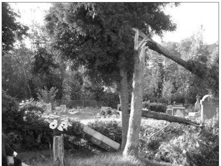
Popadané tisy v nové části jindřichovického hřbitova

Ve večerních hodinách se opět sešla první směna, aby provedla údržbu a vyčištění použité techniky, odstranění drobných závad, doplnění pohonných hmot. Vozidlo muselo být připraveno pro případný další zásah. K tomu došlo hned další den. Druhá směna vyjela na Mezihorskou, kde spadl strom na rekreační objekt. Ke splnění úkolu